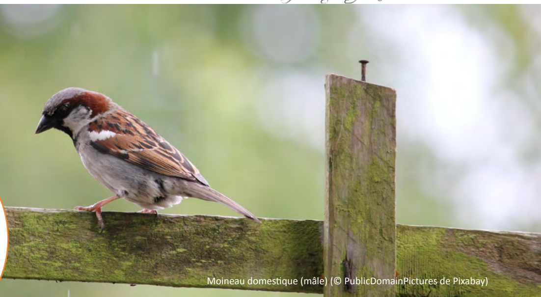
Moineau domestique (mâle)

Parmi les 93 espèces d'oiseaux recensées dans l'enquête, le Moineau domestique est l'espèce la plus prédatée par les chats, avec 1 064 données au 31 mai 2019. Bien que commune, cette espèce est aujourd'hui en déclin dans tous les milieux urbains d'Europe. D'après le Suivi Temporel des Oiseaux Communs de l'observatoire Vigie-Nature, la population française a diminué de 13 % en 18 ans. Son déclin est attribué à plusieurs causes dont la pollution, la difficulté à trouver des sites de nidification (trous de mur) dans les bâtiments neufs, et le manque de nourriture lié à l'intensification de l'agriculture. La prédation par les chats domestiques s'ajoute également à ces menaces.