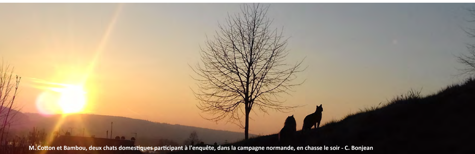
M. Cotton et Bambou, deux chats domestiques participant à l'enquête, dans la campagne normande, en chasse le soir - C. Bonjean

Nous espérons que les réponses au questionnaire que proposera Romain Eichstadt permettront de mieux comprendre les raisons qui amènent les gens à laisser leur chat libre d'aller et venir, et dans quelles conditions, ainsi que les différences d'impact possible entre chats de cette catégorie à la campagne ou à la ville.