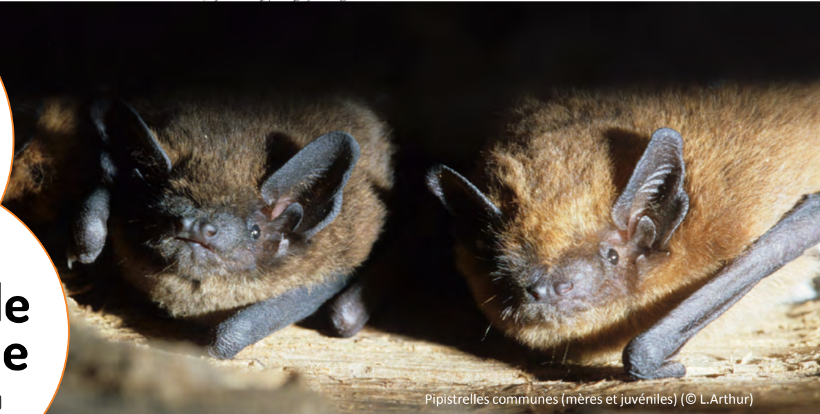
Pipistrelles communes (mères et juvéniles)

Les chauves-souris représentent environ 2 % des proies rapportées par les chats depuis le début de l'étude. Parmi elles, 16 % sont des pipistrelles communes. Cette espèce fréquente tous les types de milieux, y compris les zones fortement urbanisées : craignant peu la lumière, elle chasse les insectes directement autour des éclairages publics ! Bien que largement répartie en France métropolitaine, la Pipistrelle commune est considérée comme " quasi menacée " d'après la Liste rouge des mammifères de France publiée en 2017 avec une diminution de ses populations à près de 60 % en 15 ans d'après les estimations du programme Vigie-Chiro en 2018 ! Si vous trouvez une chauve-souris capturée par votre chat, n'hésitez pas à contacter un spécialiste du réseau SOS Chauve-souris ! Connaissez-vous l'opération Refuge pour les chauves-souris ? Pour en savoir plus, c'est ici !